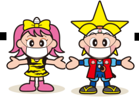
岡山県マスコット「ももっち・うらっち」